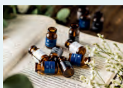
◆強髪 (頭皮のエイジングメニュー)

◆推薦商社登録企業 (2024年8月～) 株式会社HSC 〒550-0015 大阪府大阪市西区南堀江1-16-9 TEL 080-9121-9401【担当：奥】 ホームページ 強髪 検索