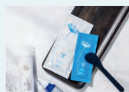
◆炭酸ガスパックの老舗会社です。